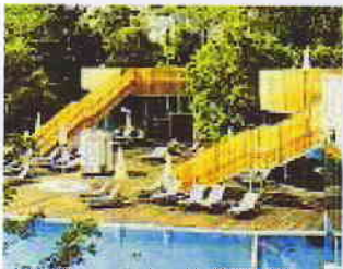
Life Medicine Resort: norwegisches Design im alten Kurpark