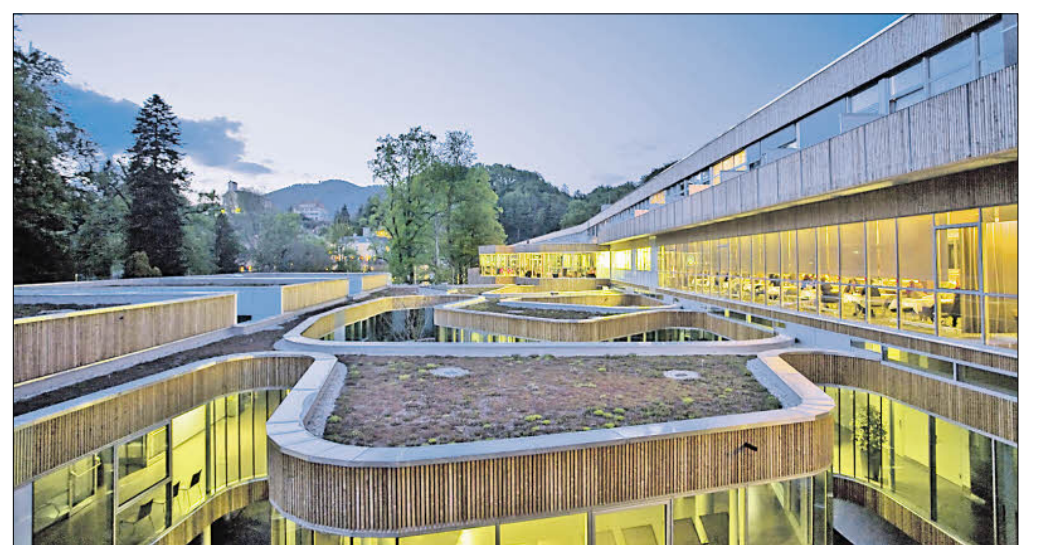
Kurhaus Bad Gleichenberg: Mäandrierende Gebäudeschleifen erlauben eine Öffnung zum Außenraum und verschränken die Anlage mit einer historischen Parkanlage.