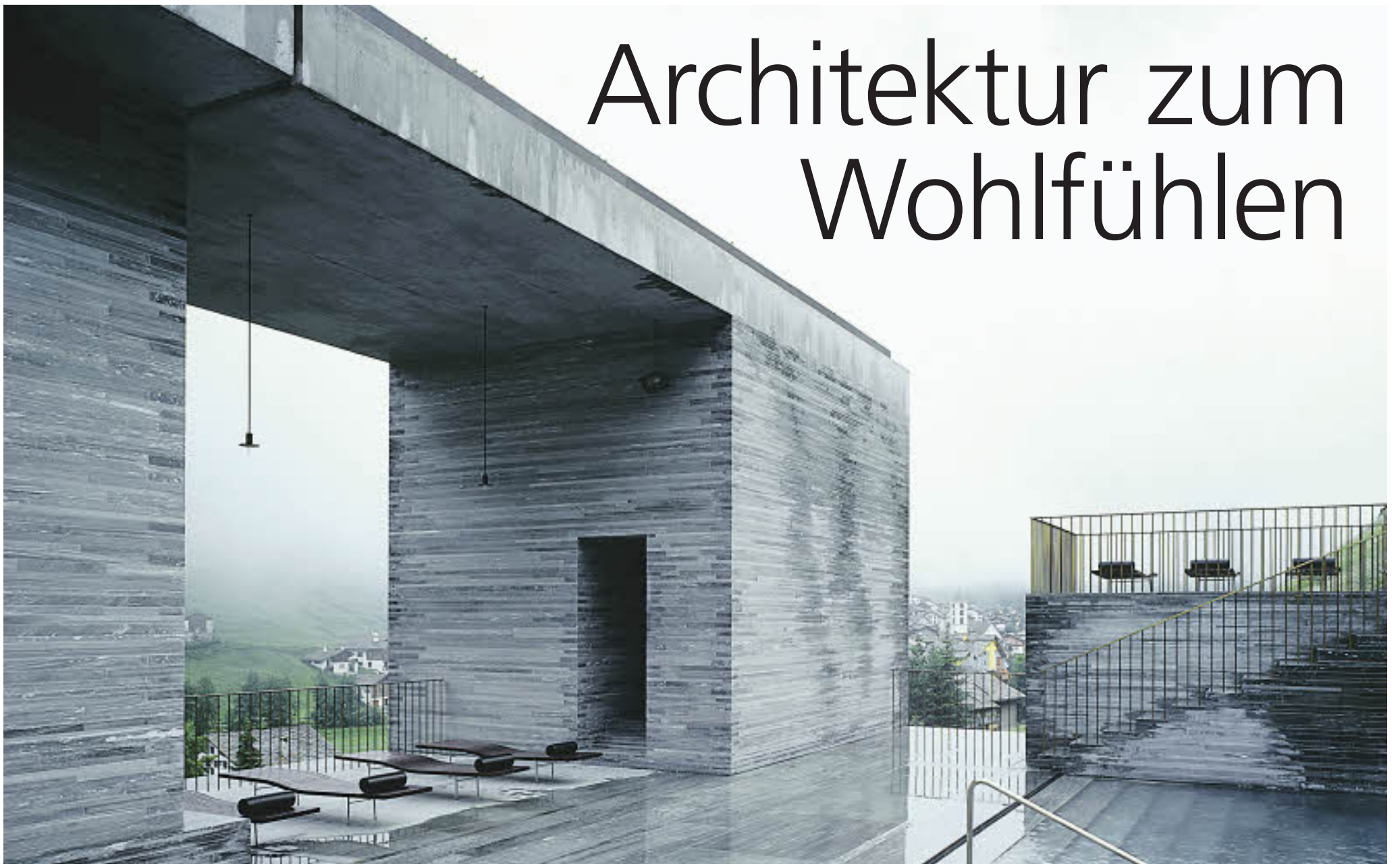
Thermalbad Vals des Schweizer Architekten Peter Zumthor: Die konsequent reduktionistische Architekturhaltung machte eine Therme zu einer der Architekturikonen der 90er Jahre.