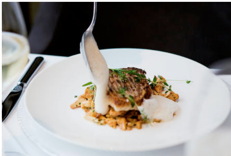
Menyen består hovedsakelig av lokale delikatesser. Otto Bauer sverger på at det bare er 680 kalorier i denne godbiten.

Stjernekokken Otto Bauer svinger forbi med en klar oksesuppe med oppskårne pannekaker i. Menyen består hovedsakelig av lokale delikatesser, som babysvin, asparges og den grønne oljen av gresskarfrø. Bauer ble lokket hit fra en lukrativ kokketilværelse i Tyrol, med løfte om frie hender til å utvikle en vitenskapelig helsematlinje.