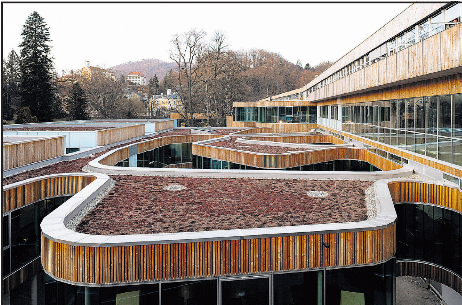
Wenn ein Gebäude mäandert ...